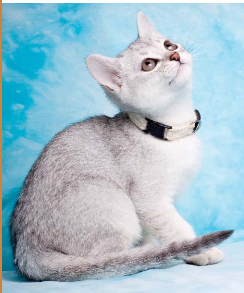
Umbro Sweety Burms, Cz burmilla modrá stříbřitá stínovaná.