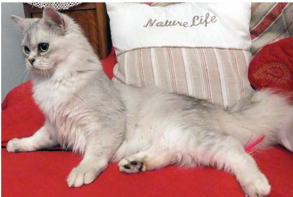
Ukázka dlouhosrsté burmilly tzv. Tiffanie, Bellabonny Prince des Neiges, ES.

V Británii se začínající chovatelé nového plemene rozdělili do dvou skupin. Jedni byli obdivovateli a zastánci chovu zlatých a dlouhosrstých burmill (sdružili se v GCCF), a ti druzí zastávali původní cíl vytvořit krátkosrsté plemeno pouze ve stříbrné barvě (pod FIFe).