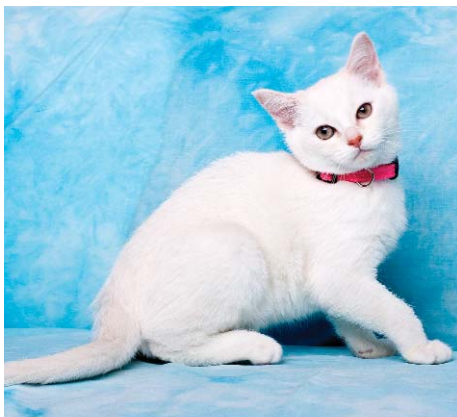
Utrillo Sweety Burms, Cz burmilla červená stříbřitá stínovaná.