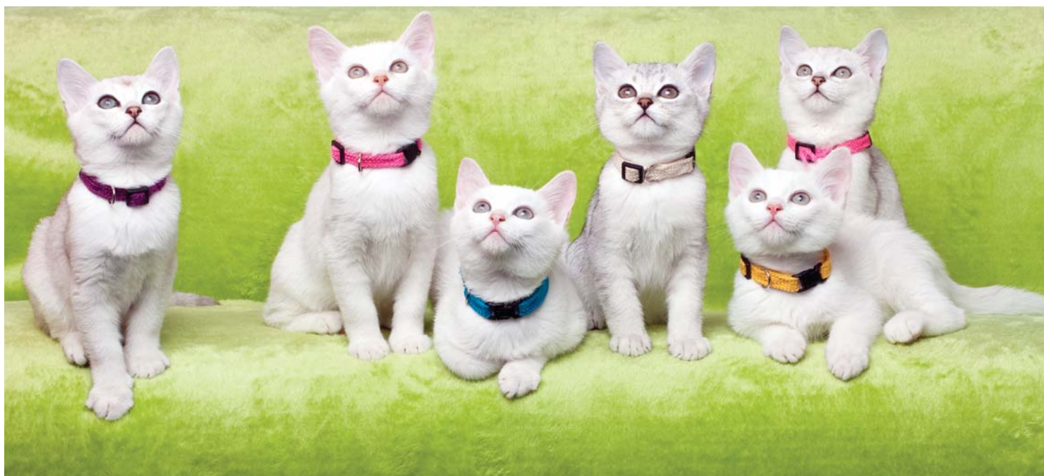
Koťátka z vrhu U Sweety Burms, Cz.

V roce 2009 se čeští chovatelé burmill rozhodli založit Burmilla Club. Ten funguje jako volné sdružení chovatelů a milovníků burmill. Chovatelé burmill na společný web umísťují novinky, informace ze života českých a slovenských burmill, seznam chovatelských sta-