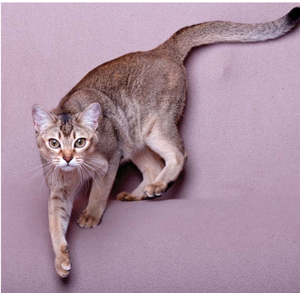
Terinka Sweety Burms, Cz - burmilla želvovinová zlatá stínovaná.

Barva: Zářivá, výrazná, s tmavým orámováním odpovídajícím barvě srsti. Všechny odstíny zelené, čistě zelené je dávana přednost. Nádech žluté barvy oka je tolerován u koťat a jedinců mladších než dva