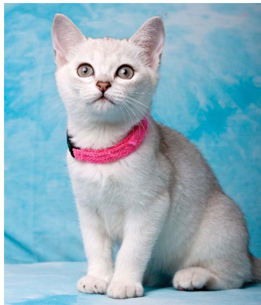
Ursella Sweety Burms, Cz - burmilla černá stříbřitá stínovaná s barmským ředěním.

a výrazná část chlupu nad ní je stříbrná, u stínované barevné variety je konec chlupu zbarven do \frac{1}{3} jeho délky a u závojové do \frac{1}{8} . Stínovaná má tedy výraznější barevný odstín než závojová.