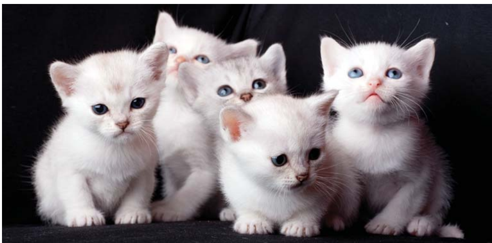
Koťátka z vrhu U Sweety Burms, Cz.

V Anglii a Austrálii je velice rozšířen chov dlouhosrstých burmill (Long hair burmilla). Jejich označení i způsob plemenitby se liší. Anglické dlouhosrsté burmilly označujeme jako tiffanie, a jsou to kočky s dlouhou srstí, které se rodí burmillám. Anglické tiffanie jsou předběžně uznány u GCCF od roku 1999. Jsou označovány také jako dlouhosrsté asijské kočky.