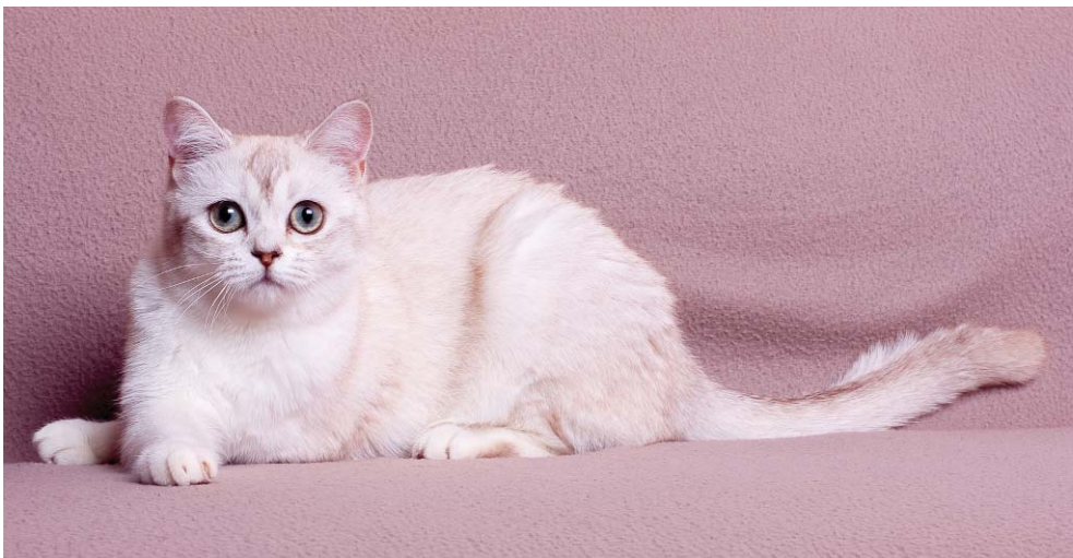
Bellabonny Perce Neige, ES - burmilla čokoládová stříbřitá závojeová.

Tvar: Jemně zakulacená lebka se středním odstupem mezi ušima, široká v horizont-